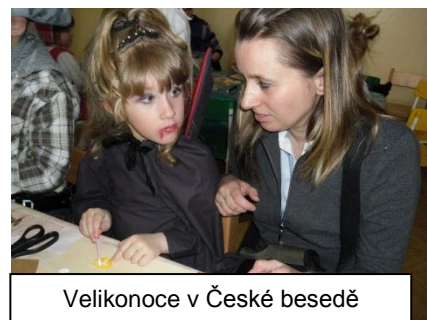
Velikonoce v České besedě