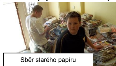
Sběr starého papíru

V červnu byla vyhodnocena sběrová akce, která probíhala od 21. 5. do 25. 5. - sběr starého papíru. Po úspěšné podzimní akci, kdy jsme sebrali přes 3 tuny, jsme očekávali, jaké výsledky budeme mít tentokrát. Celý týden nosili žáci a hlavně jejich rodiče balíky papíru. Žáci 7. B třídy dobrovolně a velmi zapáleně pomáhali s vážením a vykládáním. Za celý týden se sebralo 4092,20 kg , což je ještě více než na podzim. Peníze za sběr byly opět rozděleny podle množství vybraného papíru do fondů jednotlivých tříd. Žáci tak mají možnost, spolu s třídními