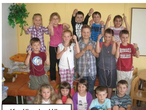
Korálky do dálky

budou představeny na letošním festivalu Pelhřimov - město rekordů 8.- 9.6.2012