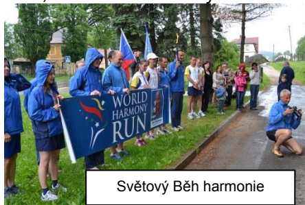
Světový Běh harmonie

World harmony run (Světový běh harmonie) je neobyčejný běh s hořící pochodní, kterou nesou statisíce dobrovolných běžců přes více než 140 zemí světa. Pochodeň symbolizuje vše, co nás spojuje bez ohledu na naši národnost, kulturu a víru - přátelství, porozumění a harmonii. Běh založil v roce 1987 sportovec, umělec a mírový filozof Sri Chinmoy. Jsme rádi, že tento běh proběhl i Raspenavou. Běžce v neděli 10. června 2012 před školou přivítaly děti z mateřské školy, které jim zahrály krásné skladbičky na flétničky. Uvítání pokračovalo vystoupením žáků ze ZŠ speciální a dětí z Domova. Zazpívali několik lidových písniček, zejména velmi aktuální Prší, prší, jen se leje. Ale ani déšť nemohl zkazit pěknou atmosféru harmonie, kterou sebou běžkyne a běžci přinesli. Ta je jistě znát i z fotografií.