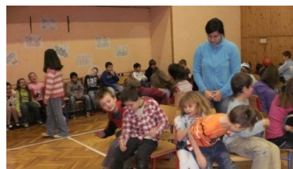
Soutěžní odpoledne pořádané našimi parlamentáky