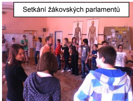
Setkání žákovských parlamentů