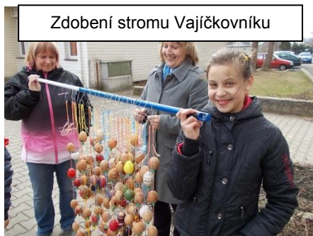
Zdobení stromu Vajíčkovníku

budeme mít v budoucnu možnost opět se s naší partnerskou školou setkat a vzájemně si pomoci se zlepšováním práce našich parlamentů.