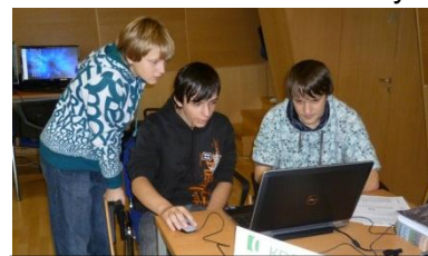
Geografické systémy v krajské knihovně

V úterý 22. listopadu navštívili žáci 9. třídy a několik žáků 8. třídy Krajskou vědeckou knihovnu v Liberci, aby zjistili, co to jsou geografické informační systémy (GIS). Během třídní celosvětové akce „Dny GIS“ (anglicky GIS Day) se každoročně představuje několik organizací využívajících GIS. Žáci si mohli na vlastní kůži vyzkoušet, jak geografické informační systémy fungují. K dispozici jim byli odborníci i studenti univerzity, kteří je na jednotlivých stanovištích seznamovali s konkrétními mapovými úlohami.