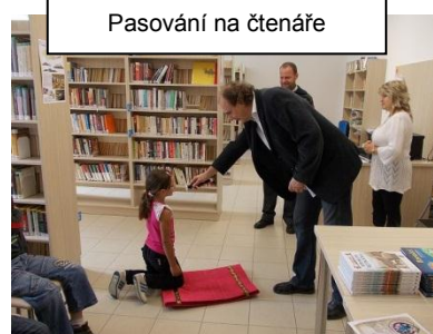
Pasování na čtenáře

V pondělí 25. června jsme uspořádali sportovní den. Nesoutěžilo se ale v tradičních sportovních disciplínách. Žáci 2. stupně byli rozděleni do dvanácti družstev; každé družstvo postupně prošlo dvanácti stanovišti, kde jednotliví členové týmu museli