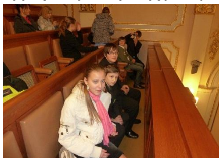
Naši „parlamentáři“ v Poslanecké sněmovně

Tentýž den – v úterý 22. listopadu žáci našeho žákovského parlamentu společně s dalšími žáky zapojenými do projektu Respektující žákovský parlament, prezentovali výsledky své práce v Poslanecké sněmovně