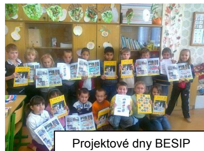
Projektové dny BESIP

V dnešní uspěchané a motorizované době není jednoduché pohybovat se v běžném silničním provozu. Proto paní učitelky z 1. stupně zorganizovaly pro žáky projektové dny BESIP. Akce začala u prvňáčků a druháků. Cílem bylo seznámit se se všemi dostupnými dopravními prostředky a s nutností být viděn. Každá ze tří tříd měla individuální i společný program. Prvňáci se prostřednictvím interaktivní tabule a pracovních listů seznámili s dopravními prostředky – umí je pojmenovat, zapsat. Druháci rozdělili dopravní prostředky podle možnosti použití – ve vzduchu, na zemi, na vodě a pod vodou. S tímto dělením si zahráli několik her. Dopravní výchova se prolínala ve všech předmětech, v českém jazyce a matematice děti řešily různé typy úloh s dopravní tematikou, v pracovním vyučování vyrobily dopravní značky, ve výtvarné výchově zhotovily společný vláček. V tělesné výchově, která probíhala v plaveckém bazénu si zahrály na dopravní prostředky a v hudební výchově si zazpívaly písně s dopravní tematikou. Společný projekt se všem líbil a do budoucna v něm určitě budeme pokračovat.