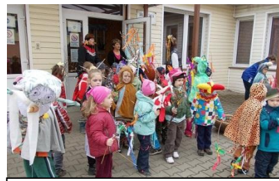
Vyhánění zimy – děti z MŠ