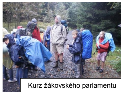
Kurz žákovského parlamentu

V sobotu 17. září jsme s naším žákovským parlamentem vyrazili na putovní prožitkový kurz do Lužických hor. Putovali jsme z Heřmanic v Podještědí do skautské základny Seleška, druhý den do Horní Světlé a třetí den do Jiřetína pod Jedlovou. Všichni účastníci byli moc stateční, protože i přes nepříznivé počasí a těžké batohy si při putování zachovali veselou mysl a dost síly nejenom na celou dlouhou cestu, ale i na to pomoci kamarádovi.