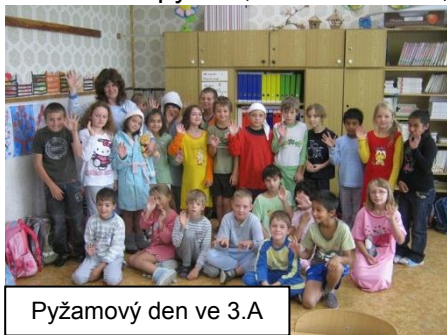
Pyžamový den ve 3.A