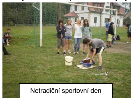
Netradiční sportovní den

12. Června 2012 jsme se zúčastnili tradičních Her třetího tisíciletí, které pořádá Základní škola a Mateřská škola Hejnice. Naši žáci byli rozděleni do různých týmů a přivezli si diplomy za výborné výkony.