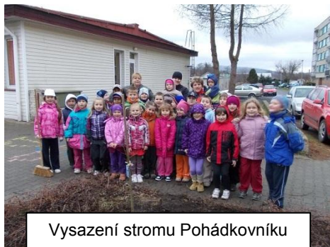
Vysazení stromu Pohádkovníku

oslavil 100 let. Děti se sešly v pátek v 18.00 h u školy. Na začátku jsme slavnostně zasadili