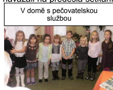
V domě s pečovatelskou službou

V předvánočním čase jsme po delší odmlce opět navázali na předešlá setkání žáků I. stupně s obyvateli Domu pečovatelské služby. Navštívili jsme babičky a dědečky, abychom jim zpřijemnilí dlouhé chvíle svými písněmi, koledami, básničkami a hrou na flétničky. Děti nepřišly s prázdnou, každému z přítomných přinesly dárečky, které vyrobily ve školní družině. Na děti čekala sladká odměna, občerstvení a ovoce. Setkání bylo velmi příjemné, spolu s dětmi si všichni zazpívali koledy, zbyla i chvilka si se všemi popovídat. Každý žák při odchodu popřál babičkám a dědečkům pevné zdraví s příslibem brzkého setkání v jarních měsících.